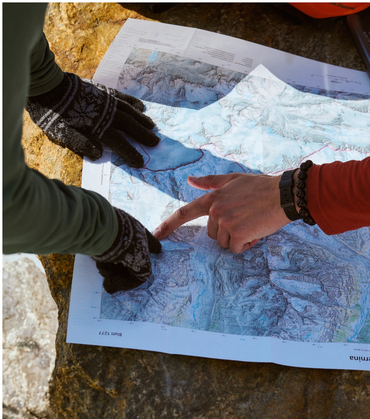
Meerjarenplan NKBV 2025-2028

de verschillende sporten en beschrijft hoe we daarbij de regio's, secties en klimverenigingen kunnen ondersteunen. Het plan richt zich op het behouden en delen van kennis en ervaring, en houdt tevens rekening met de gevolgen voor de interne organisatie.